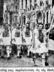
Μία άριστη άρση...