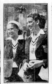
Η «ταχύ» άρση...