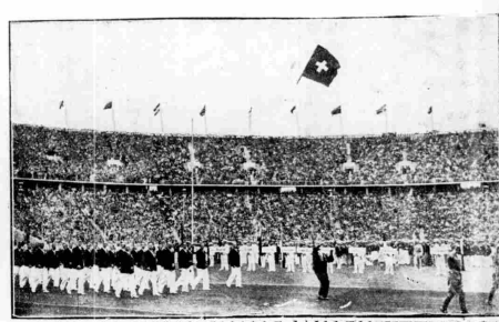
Μία άριστη άρση...